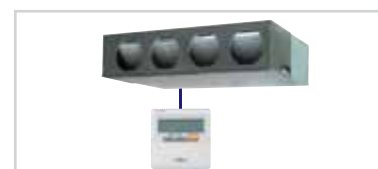
Total configuración desde el mando